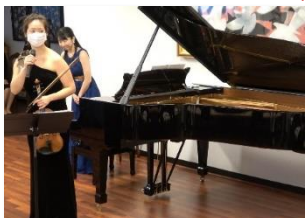
チャームングなお人柄が滲み出てくる泉さんのトーク