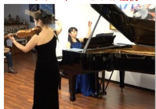
お二人の気迫がこもったフォーレ