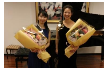
素晴らしい演奏をありがとうございました。