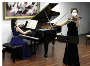
モーツァルト：ピアノが主役