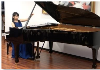
バルトーク：名演でした。