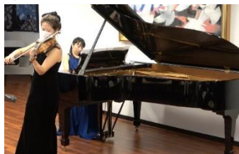
アンコールに会場中がうっとり