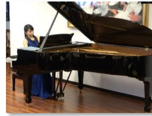
美しく切ないセレナーデ