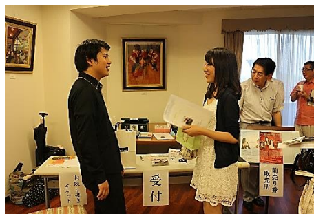
留学時代のご友人と。