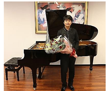
魂がほとばしる熱演でした！！