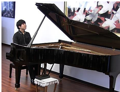
無駄な音が1音もない 洗練されたモーツァルト

♪「熱情」の熱演には久しぶりに感動しました。ピアノのひびきもすばらしく、熱演にこたえているように、思いました。朝日ホールでの演奏を是非聞かせて頂きたい。益々の発展を期待しております。