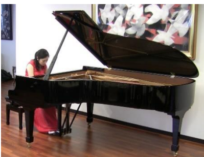
魂のこもったプログラム最後の和音