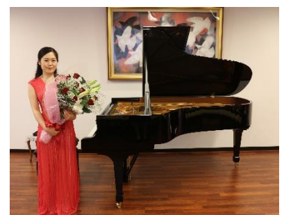
感激の渦に巻き込まれた熱い演奏会でした