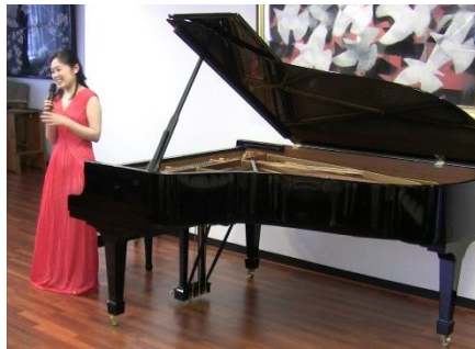
トークではピアノとの出会いについて楽しくて語られました。