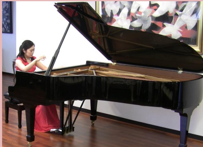
写真：バルトーク熱演中