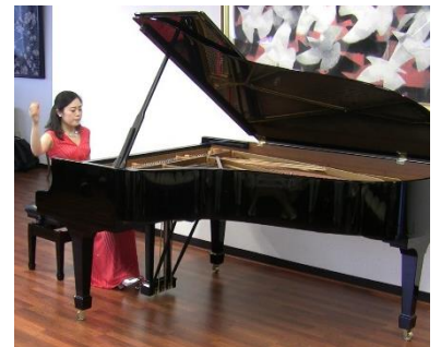
情熱的で美しいリスト