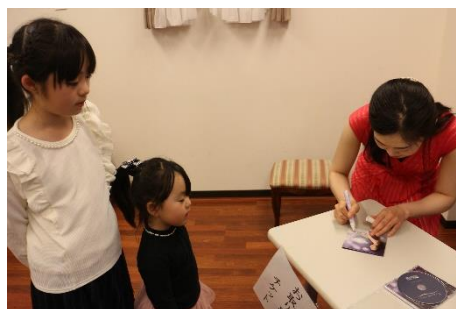
CDをお買い上げの未来のピアニストさんたちにサイン。